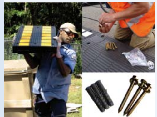
Kein schweres Gerät erforderlich, lediglich allgemein gebräuchliche Werkzeuge